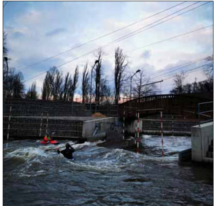
März-Training im tschechischen Roudnice