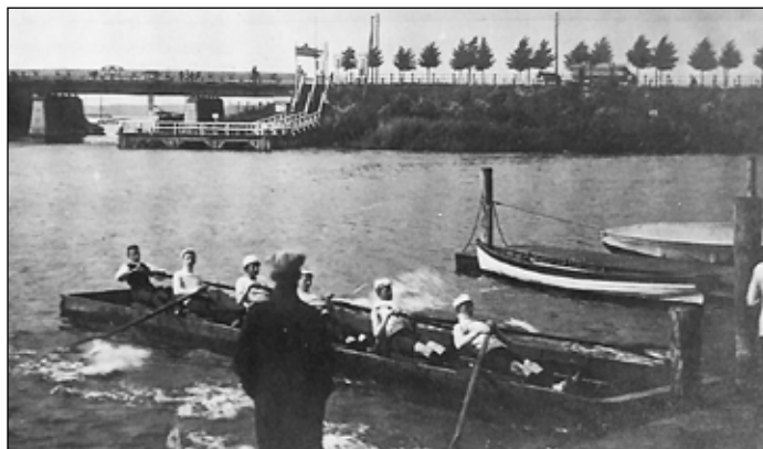
Der Ruderkasten. In Teil 2 der Erinnerungen von Artur Thieß war die Rede von der Überführung eines zweiseitigen Ruderkastens von der Bootswerft Trometer zum Bootshaus in Wendenschloß. Die meisten von uns kennen als Ruderkasten nur eine fest installierte Überdachte Anlage. Unser Bild zeigt im Unterschied dazu einen sechszelligen Kasten, der an Land befestigt wurde, beim Schülerruderverein am Kleinen Wannsee (im Hintergrund die Wannseebrücke). Das Foto von einer Postkarte dürfte vor etwa 100 Jahren entstanden sein. Aus der Vereinszeitung des Potsdamer RC Germania

In Dunkelheit und Schweigen in voller Auflösung wie Kriegsschiffe nach einer verlorenen Schlacht, so fuhr die ehemals stolze Postflotte heimwärts. Das war das tragische Ende der so fröhlich begonnenen Korsosfahrt.