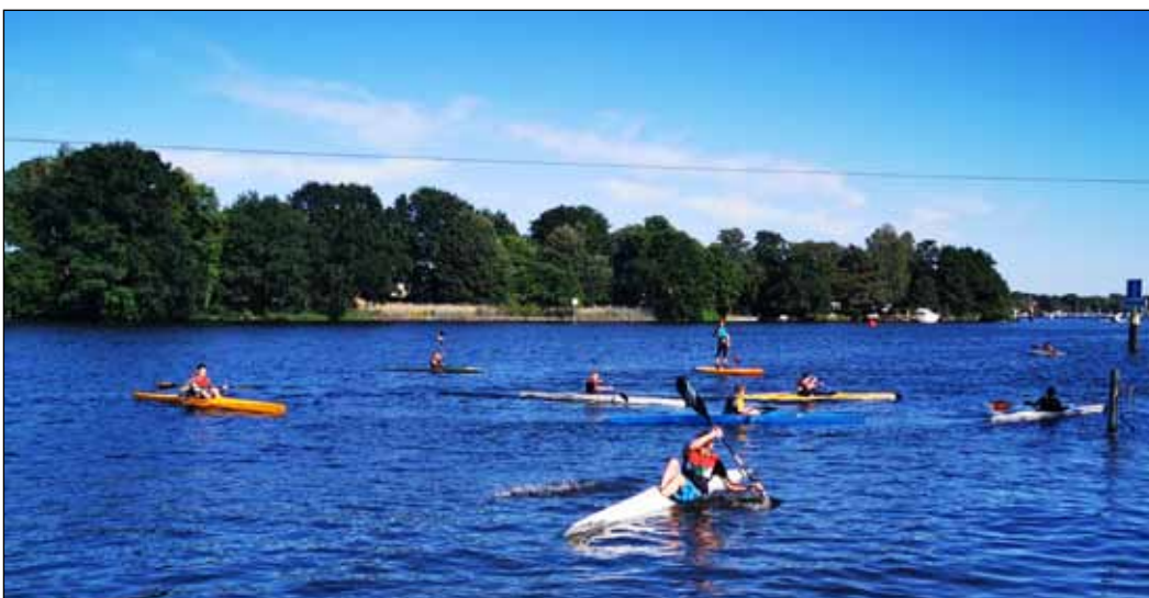
Letztes Training vor den Sommerferien auf der heimischen Dahme

Weitere erstaunliche Nachrichten kamen auch vom Deutschen Kanuverband: Die Deutschen Meisterschaften der Schüler im Kanuslalom werden im September nachgeholt! Die Schufferei im Winter war also doch nicht umsonst, ab August konnten wieder Regatten ausgetragen werden. Unsere Sportler sind voll motiviert und mit Spaß beim Training dabei. So kommt unsere kleine, aber feine Kanuabteilung am Ende sogar gestärkt durch die Krise und blickt frohen Mutes in eine hoffentlich krisenfreie Zukunft. Robert Winkler