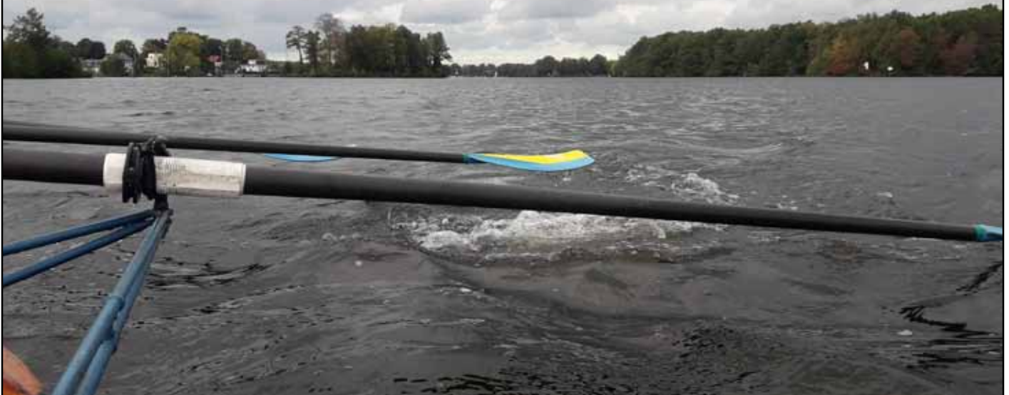
Winterstimmung auf dem Wasser