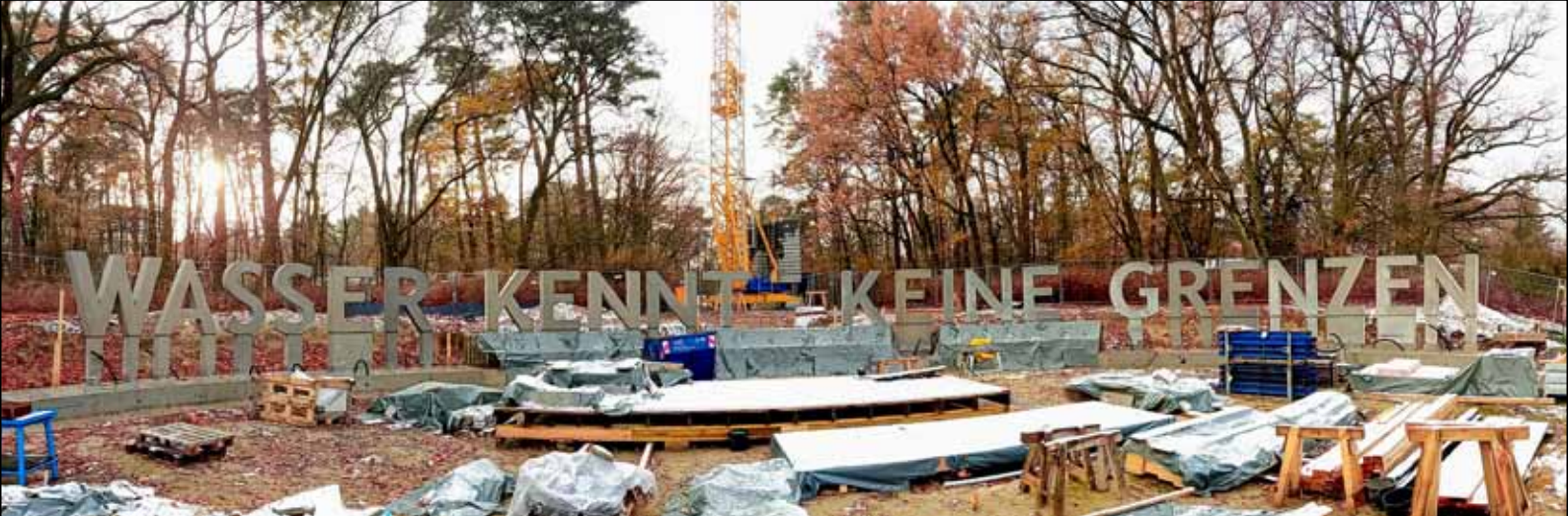
Rohbaufertig: das neue Denkzeichen am früheren Standort des Grünauer „Sportlerdenkmals“ (das eigentlich ein Kaiserdenkmal war)