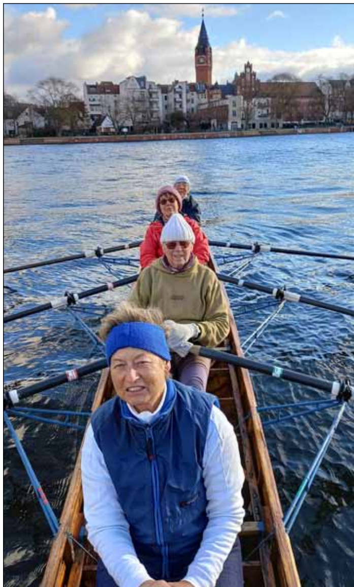
„Eierfahrer“ im Januar 2023 im Köpenicker Becken

Ä = Äquatorpreis; in Klammern Werte aus vergangenen Jahren, sofern der Fahrtenwettbewerb erfüllt wurde; Erfüller 2022 über der Punktlinie.