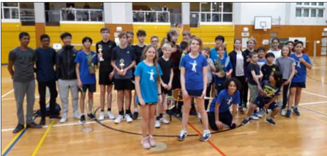
Spieler des Monats Oktober 2022