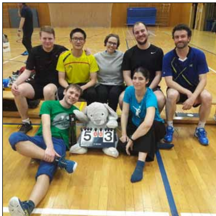
Die Zweite ist in guter Stimmung.

Eine turbulente Hinrunde liegt hinter uns, am Ende steht der 2. Platz in der Landesliga. Trotz des vorläufigen verletzungsbedingten Verzichts auf unseren