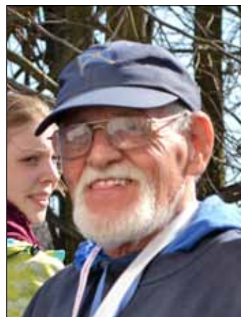
65, 45, 25 ... jeweils 20 Jahre Abstand – nicht im Lebensalter, aber in der Zahl der Fahrtenabzeichen: