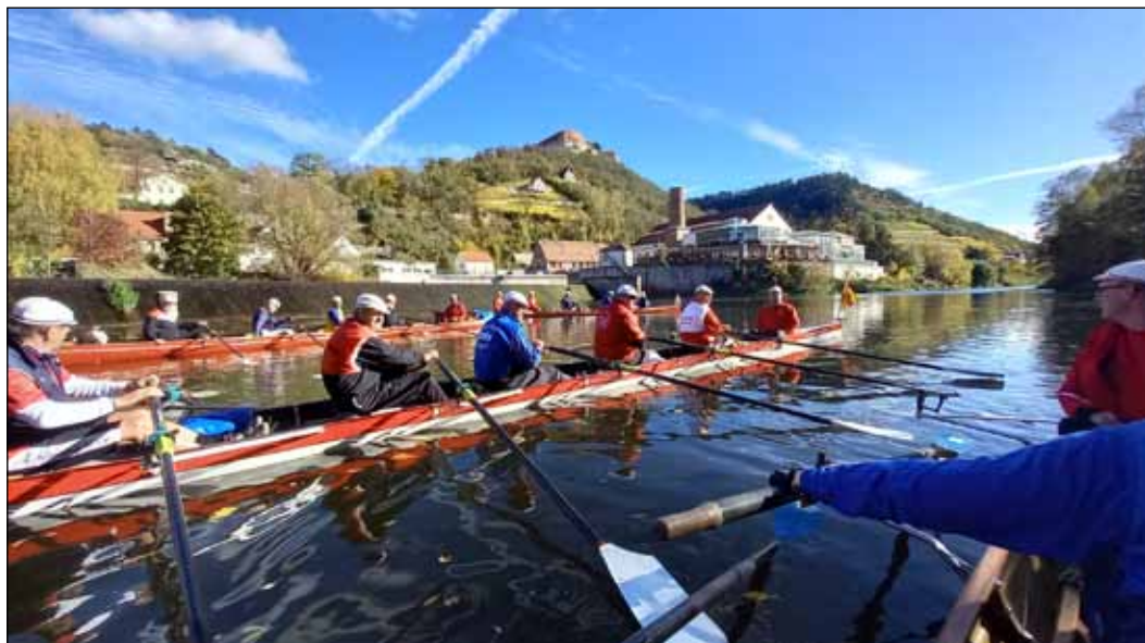
An den Weinhängen von Freyburg an der Unstrut

Da Naumburg an der Saale unweit der Unstrut-Mündung liegt, ruderten wir am ersten Tag zunächst beide Flüsse aufwärts bis unter die Weinhänge der „Rotkäppchenstadt“ Freyburg, bevor