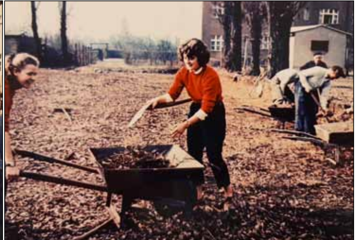
Arbeitseinsatz auf der Anlage im Jahre 1957

A m 23. Oktober 1953 waren 25 Teilnehmer bei der Wiedergründung der Tennisabteilung des Postsportvereins anwesend, 22 traten der neuen Abteilung bei.