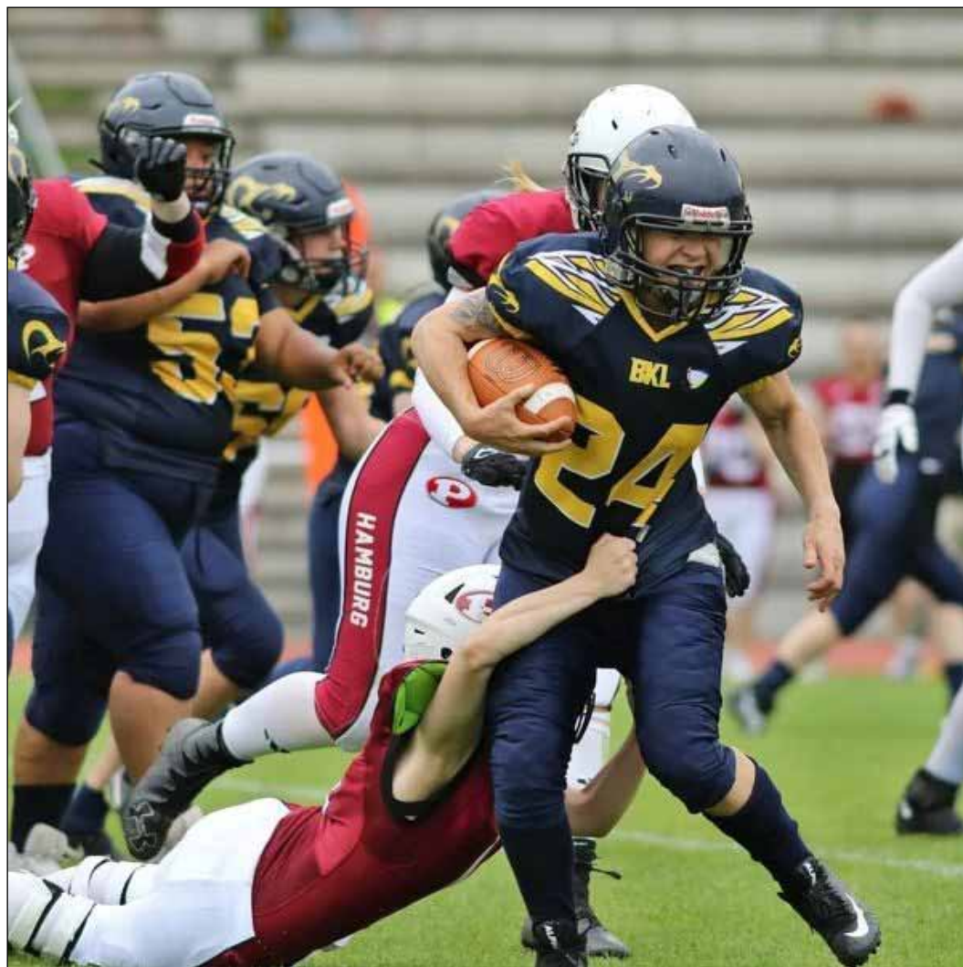
Die Kobra Ladies fanden in den Hamburger Amazonen diesmal ihre Meisterinnen.

Entsprechend motiviert ging man auf die Reise und kehrte, zur Überraschung vieler, nach einer