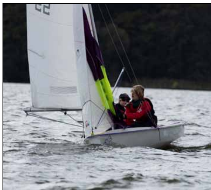
... Bruno & Max

Insgesamt waren für die drei Wettfahrttage zehn Regatten vorgesehen, die je nach Wind 45 bis 60 Minuten dauern sollten. Bei der Steuerleutebesprechung wurden die Kurse besprochen.