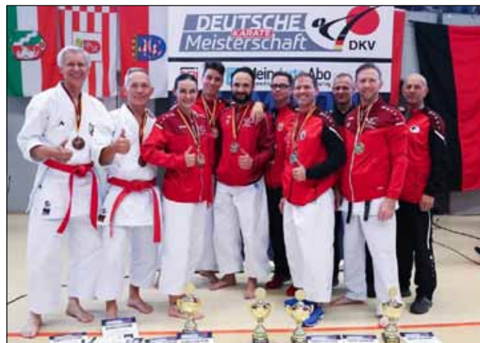
Das Berliner Meisterschaftsteam

Unsere jüngsten Mitglieder sind drei Jahre, die ältesten 65 Jahre alt. Trainiert wird in leistungsspezifischen und altersgerechten Trainingsgruppen. Mittlerweile ist unserer Karateschule bereits auf knapp 150 Mitglieder angewachsen und damit die mitgliederstärkste Karateschule der Stilrichtung Wado Ryu in Berlin.