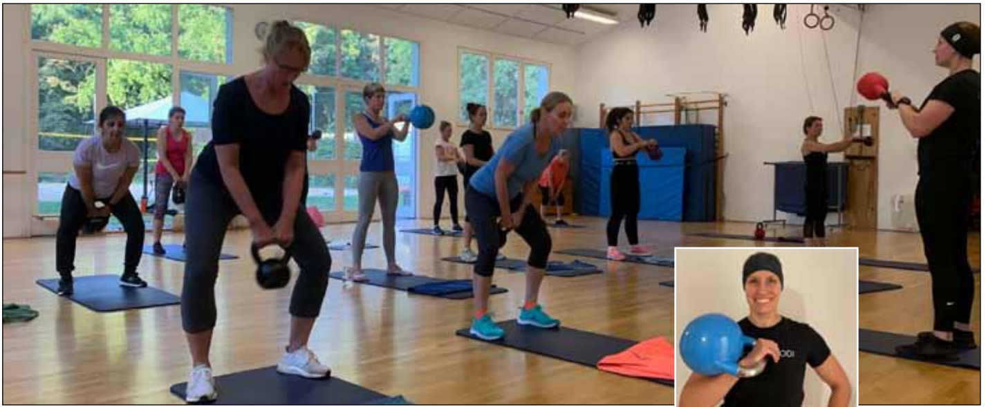
Kettlebell-Workout im ProSPORTstudio Wilmersdorf