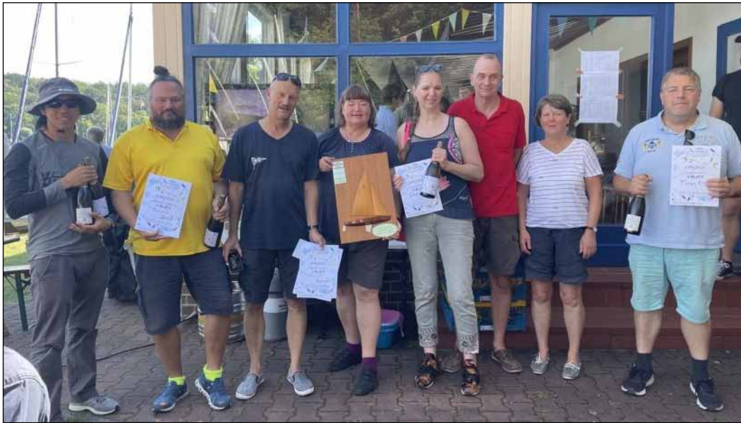
Die PSB-24-Crews nach der Freundschaftsregatta

B ei der diesjährigen Freundschaftsregatta, die vom Segel-Club Oberhavel (SCOH) veranstaltet wurde, kamen vier der 35 teilnehmenden Boote aus unserer Abteilung. Am ersten Tag herrschte leichter Wind, am zweiten Tag dominierte Flaute, so dass es keine weitere Wettfahrt mehr gab. Immerhin ermöglichten das sonnige Wetter und ein üppiges Buffet auf dem Clubgelände des SCOH eine nette Zeit zum Kennenlernen von Seglern der Nachbarvereine.