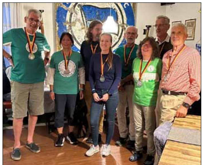
Unsere stolzen Marathonis bei der Nachlese

Übrigens: Wer stets auf dem „Laufenden“ bleiben will, was die Leichtathletik im PSB 24 betrifft, ist herzlich eingeladen, uns auf Instagram zu folgen: @psb24_running.