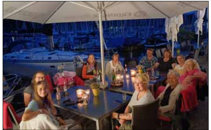
Erster Frauenabend auf der Terrasse