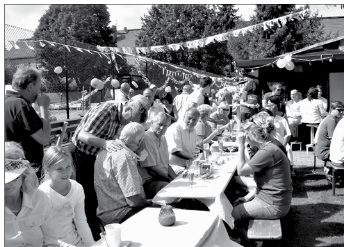
Feier zum 50-jährigen Bestehen der Anlage 2007