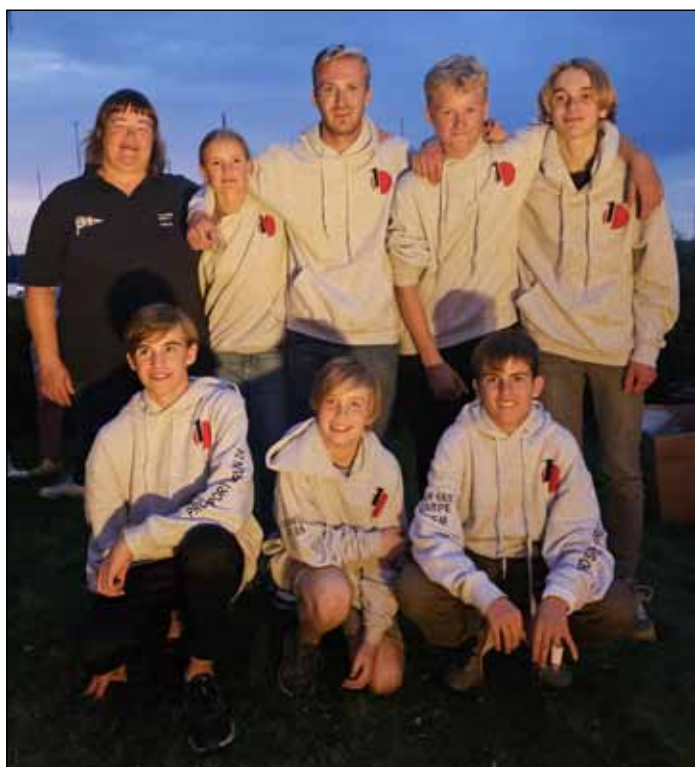
... und mit ihren Trainern an Land