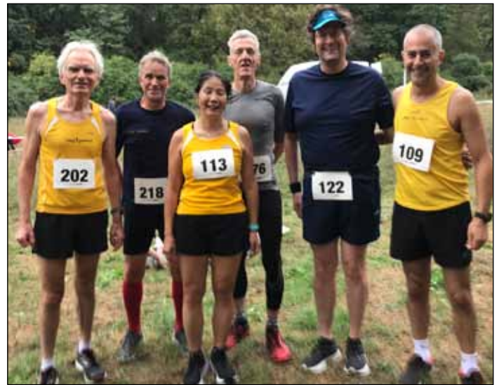
Unser Team beim Volkscrosslauf in Zehlendorf

Zum Verletzungspech gesellte sich jahreszeittypisch schlechtes Wetter beim elften Lauf des Läufercups. Mehrere Tage Dauerregen hatten dafür gesorgt, dass man eher von „Aquajogging“ unter erschwerten Bedingungen als von einem Crosslauf im Adlershofer