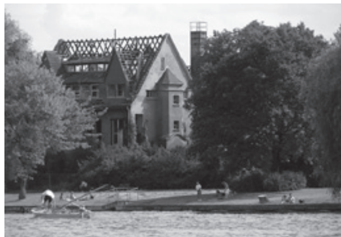
Aufnahme aus dem Jahre 2008: Spätestens seit der Brandstiftung 2003 bot das Haus einen erbarmungswürdigen Anblick.

dine“ war einer von einst acht in Köpenick ansässigen jüdischen Rudervereinen. So musste sich die Rudergesellschaft auch offiziell im Namen als „jüdisch“ bezeichnen, nachdem die Nazis in Deutschland die Macht übernommen hatten. 1938 wurde der Verein gänzlich verboten, das Haus wurde „arisiert“, eine Ansichtskarte aus Werner Philipps Archiv weist es als „Berghoff's Wassersporthaus“ aus. Nach Ende des Zweiten Weltkriegs zunächst von den sowjetischen Truppen genutzt, diente das einstige Bootshaus später als Schulungs-