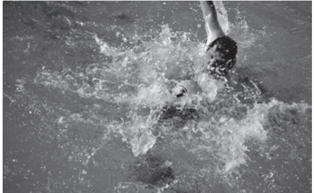
Harte Zweikämpfe über und unter der Wasseroberfläche

Das Spiel wurde sogar von zwei Schiedsrichtern der Landesgruppe Ost geleitet, die auch in der 2. Bundesliga tätig sind. Unsere Mannschaft begann mit großem Respekt und versuchte, durch eine variable Verteidigung den Gegner nicht ins Spiel kommen