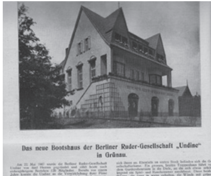
Juli 1914: „Der Rudersport“ berichtet.

Lange konnten die Mitglieder diesen Blick jedoch nicht genießen. Noch 1914 begann der Erste Weltkrieg, dem weitaus mehr als die für dieses Jahr in Grünau geplanten Ruder-Europameisterschaften zum Opfer fielen. Und: Die „Un-