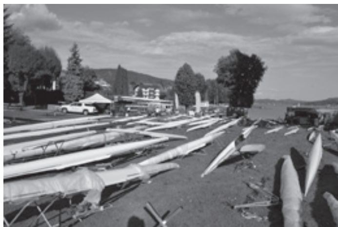
Sattelplatz der „Einbäume“ in Velden am Wörthersee

An den Gewinner der „Rose“ wurde ich knapp zwei Wochen danach am Ländli erinnert. Das Ländli, man ahnt es, liegt in der Schweiz. Genauere Ortsangabe folgt später. Im Sommer waren