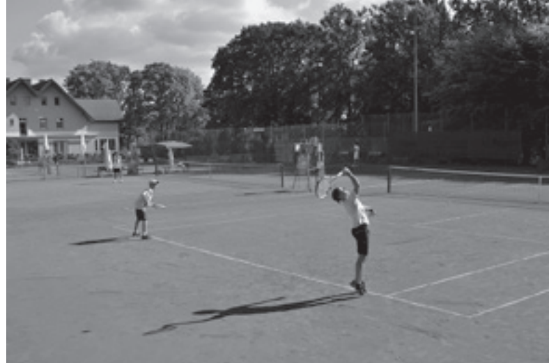
27. September: Während die Gatower Ruderer zur Sternfahrt anlässlich des 90. Vereinjubiläums eingeladen hatten, zeigte auf den Tennisplätzen die Jugend ihr Können.