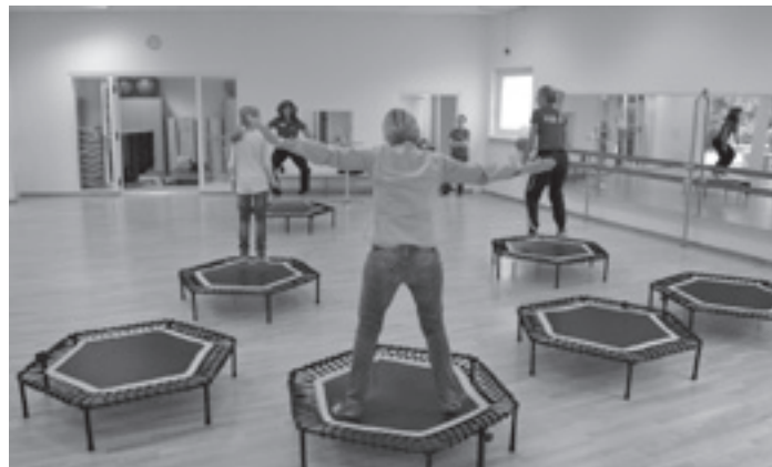
Probetraining am Tag der offenen Tür