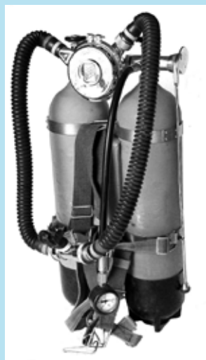
... Pressluft in die Tiefe