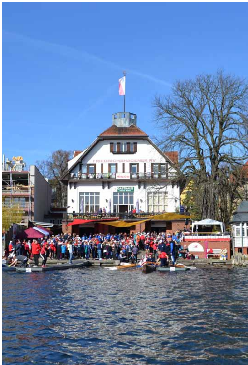
Mit dem Anrudern beim Friedrichshagener RV begann am 2. April offiziell die Sommersaison