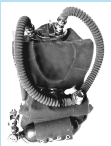
Mit Sauerstoff und ...