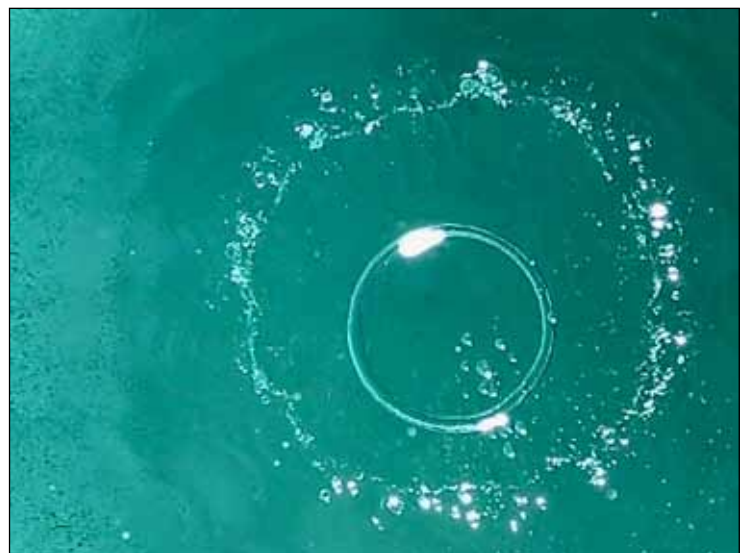
Originellstes Foto Erwachsene: Norbert Krieger