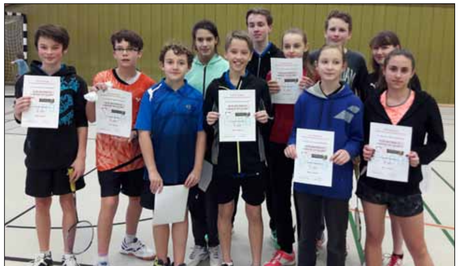
Die beiden Schülersmannschaften nach einem anstrengenden Wochenende