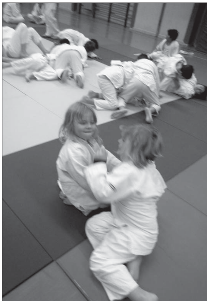
Zwei unserer Anfängerinnen beim Kampf

Die Gruppe war mit sechs Aktiven gut besetzt, wurde aber nicht im Poolsystem ausgekämpft, sondern