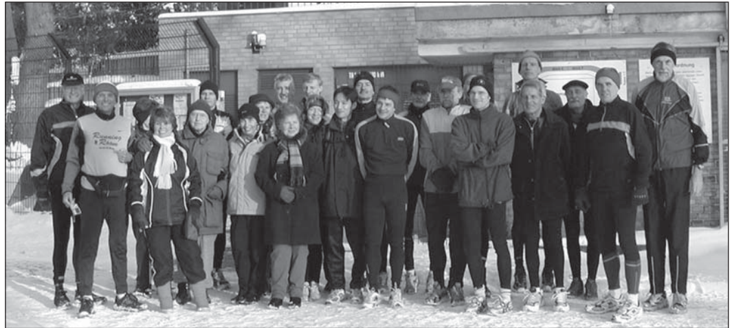
Das älteste Foto, das ich von unserem sportlichen Jahresausklang gefunden habe, ist das von 2005. Schaut mal!