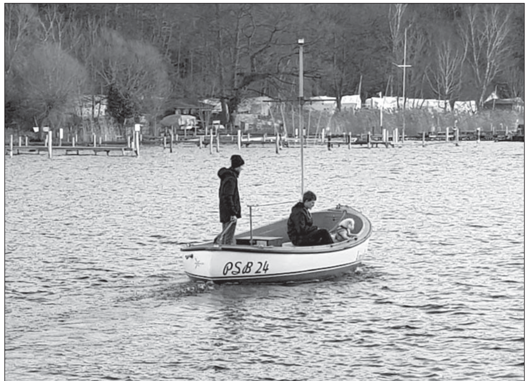
Letzte Fahrt der „Knorke“ auf der Havel