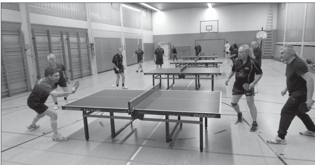
Beim Training in Tegel