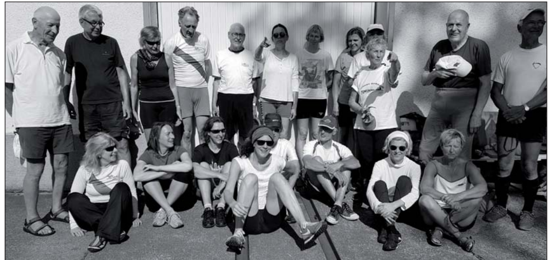
Gastgeber und Gäste in Wendenschloß

– Ooch... wir rudern eigentlich immer bis Königs Wusterhausen, das ist unsere normale Mittwochnachmittagsfahrt. 30 Kilometer.