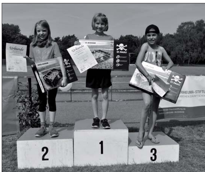
Die schnellsten drei Mädchen demonstrieren auf der Siegerehrung unterschiedliche Techniken im Umgang mit Trophäen.