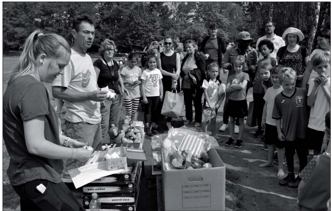
Während die Großen auf der Strecke sind, gerät die Kinder-Tombola zum Höhepunkt des Tages.