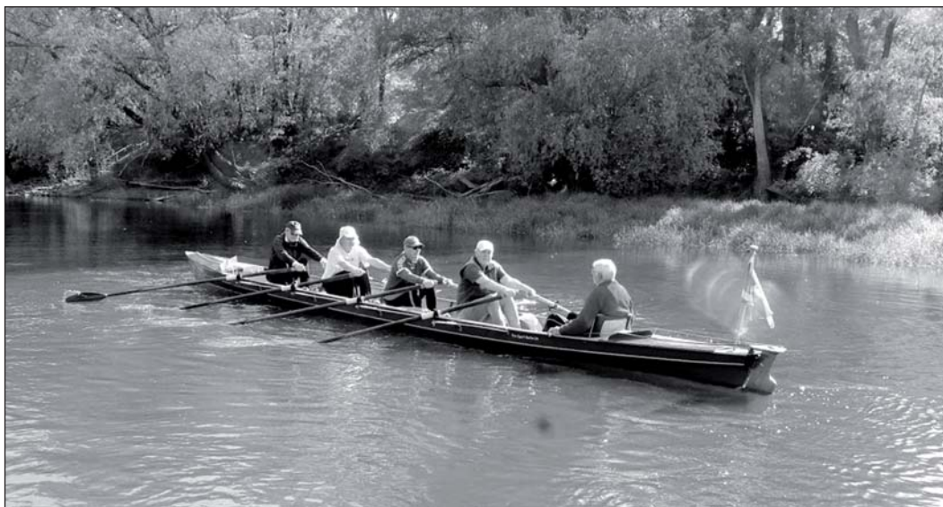
Alte Herren auf Alter Oder