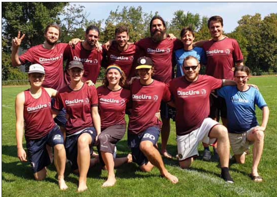
Das Meisterschaftsteam von DiscUrs Berlin, der Ultimate-Abteilung von PSB 24

In der Wintersaison findet wieder ein Anfängerkurs im Ultimate Frisbee statt. Ziel des Kurses ist es, die Grundkenntnisse des Sports sowie grundlegende Spielregeln, Wurftechniken, taktisches Denken und Schnelligkeit zu erlernen. Der Kurs findet ab dem 21. Oktober 2019 immer montags 19 Uhr statt. Jeder ist willkommen und kann sich kostenlos bei uns anmelden unter discurs.berlin@gmail.com .