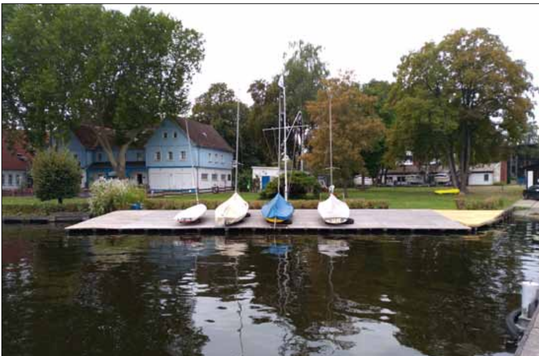
Der neue Jollensteg