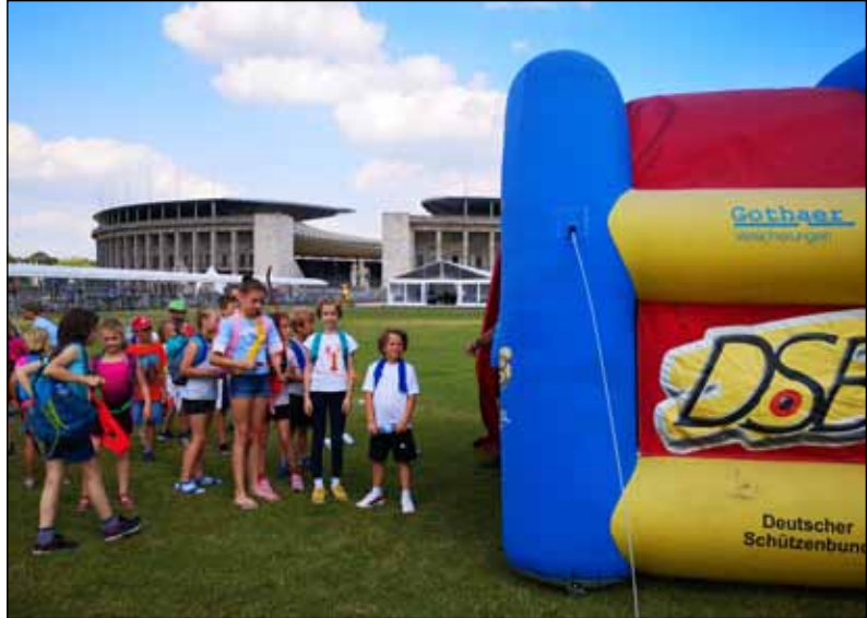
Die PSB-24-Kindergruppe am „Try-Archery-Stand“ des DSB