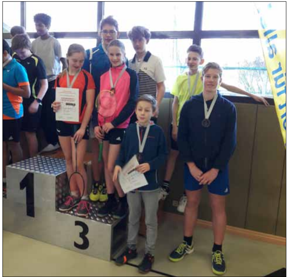
Unsere Schülermannschaft bei der Siegerehrung

Unsere Jugendarbeit trägt bereits gute Früchte