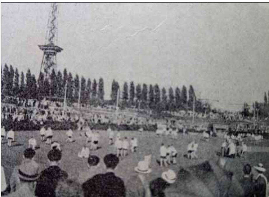
Ein Foto aus den 1930er Jahren: Vorfürungen der Judo-Abteilung im Sommergarten unter dem Funkturm